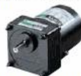
当社従来品 4GN-K 最大許容トルク8N・m