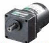
KIIシリーズ 4GV 最大許容トルク16N・m