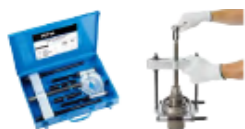
セパレート式引抜き治具