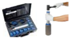
取付けツール キットケース