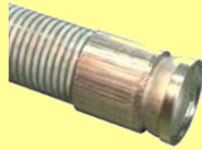
外筒加締 (Sカラー付き)