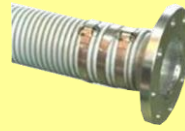
フープバンド締 (JISフランジ付き)