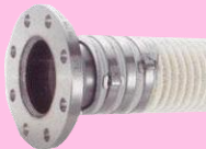
谷埋めフープバンド締 (JISフランジ付き)