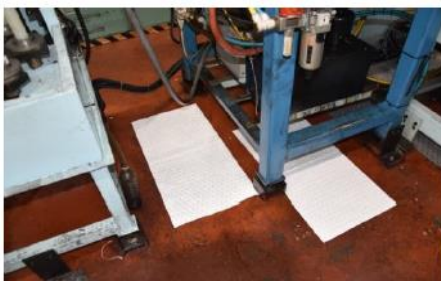
機械の漏油の吸着処理

品番 070157 品名 オイルゲット ロールタイプ サイズ 760mm×19000mm×2mm(厚さ) 入数 1ロール(19m) JANコード 498529701578