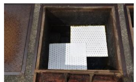
油水分離層使用例