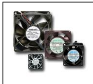
AC・DC軸流ファンモータ

◆ 低騒音・長寿命を実現し高い信頼性を確立、豊富なバリエーションと共に幅広い用途に対応しています。