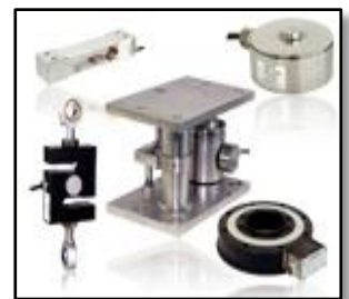
ロードセル(荷重変換器)

◆ 低騒音・長寿命を実現し高い信頼性を確立、豊富なバリエーションと共に幅広い用途に対応しています。