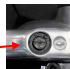
アジャストバルブ

アジャストバルブをドライバーで調節し、空気流量を変えることで、回転数を調節できます。