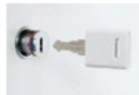
収納庫の鍵共有化