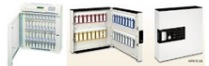
鍵はキーボックス管理