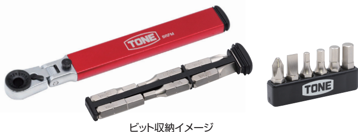
ビット収納イメージ

プッシュボタンを押すことで180°の首振り調整が可能なビットラチェットハンドル。 ロック機構で首振り角度を保持したまま作業が可能。 ビットを本体に収納できるため、持ち運びが簡単です。