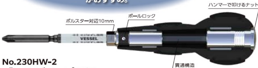
No.230HW-2 ボールグリップ貫通