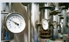
アナログメーター