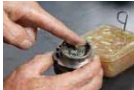
①インパクトレンチのベアリング