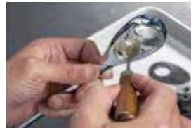
②ラチェットハンドル