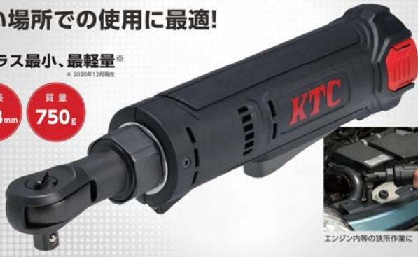
エンジン内等の狭所作業に