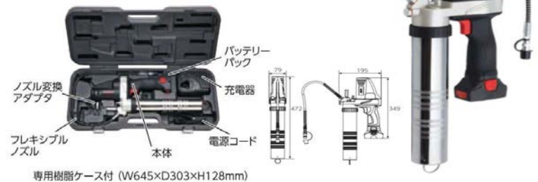
専用樹脂ケース付 (W645×D303×H128mm)