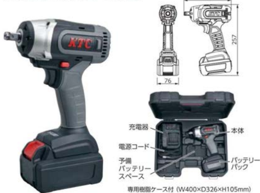
充電器 電源コード 予備 バッテリー スペース 本体 バッテリー パック 専用樹脂ケース付 (W400×D326×H105mm)