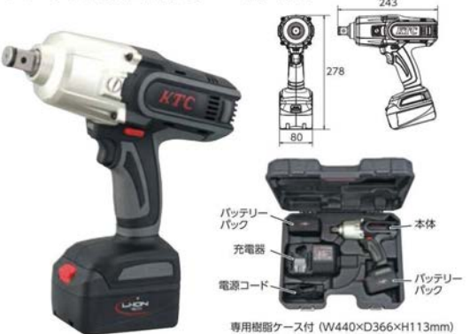
バッテリー パック 充電器 電源コード 本体 バッテリー パック 専用樹脂ケース付 (W440×D366×H113mm)